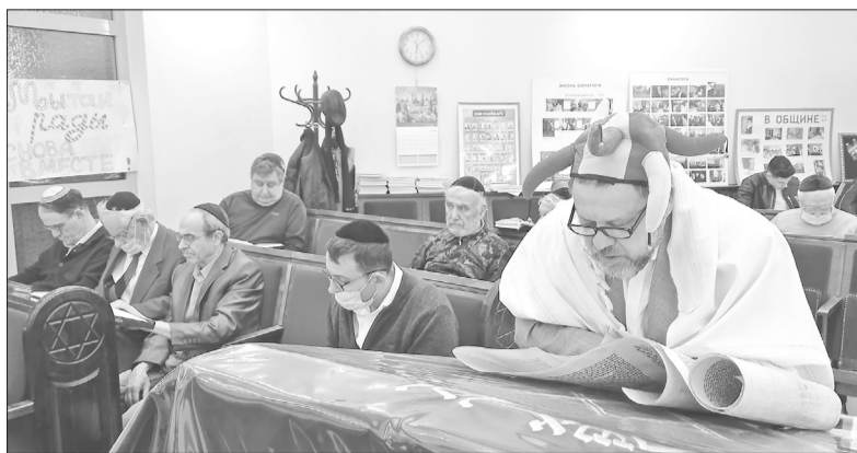
В синагоге во время чтения свитка Эстер.

«Подготовка к празднику началась в воскресном семейном