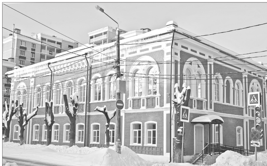
Бывший Дом губернатора после реставрации.

Соня КИРНАРСКАЯ.