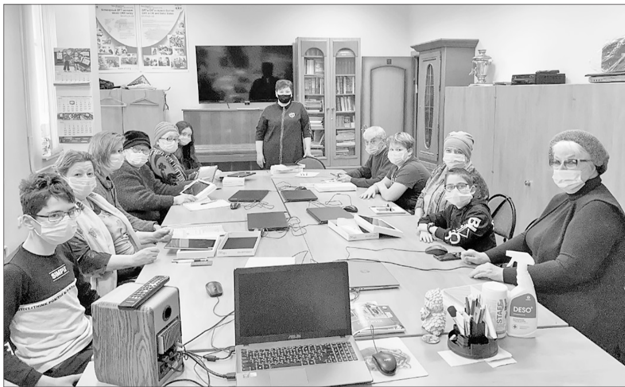
Участники «Онлайн-Клуба» обучаются работе на планшетах.

За время работы «Онлайн-Клуба» желающих присоединиться стало больше, но не у всех была возможность из-за отсутствия подходящих устройств для связи. В октябре 2021года, благо-